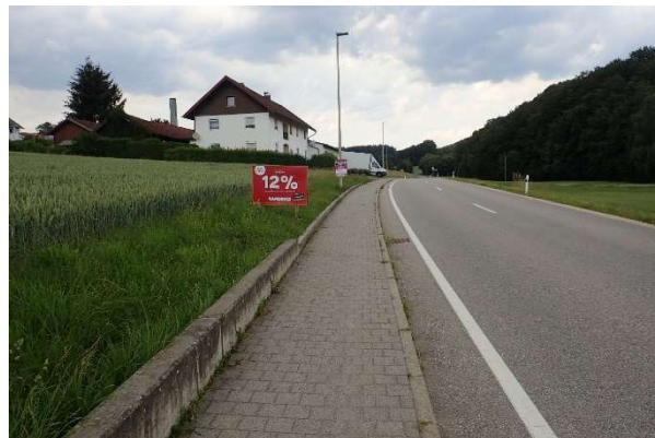
Blick entlang der Ostgrenze nach Norden zur Schreinerei Hiefinger; rechts von der Kreisstraße PAN 25 befindet sich die Aue des Lohbachs (16.06.2022)