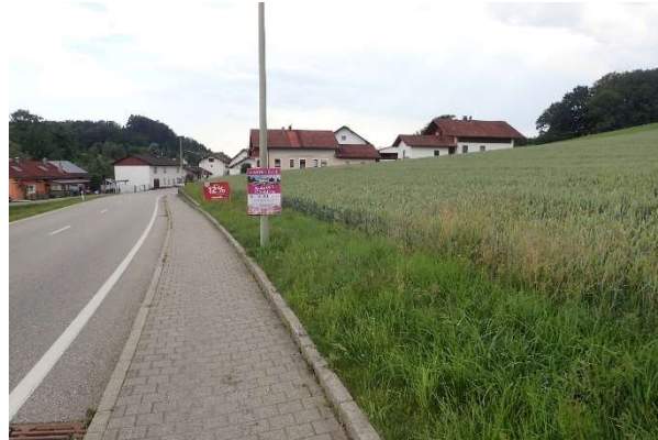
Blick vom Ostrand des Planungsgebiets in Richtung Süden; links die Kreisstraße PAN 25, rechts das Planungsgebiet (16.06.2022)