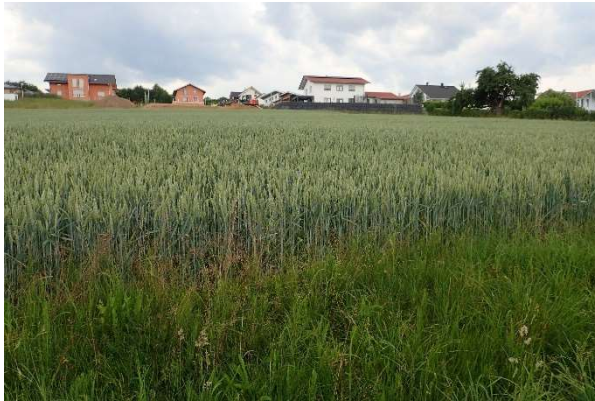
Blick nach Westen zum Baugebiet „WA Mittertaubenbach II“ (16.06.2022)

Grünstreifen über dem Schmutzwasserkanal zwischen Gehweg und Acker (16.06.2022)