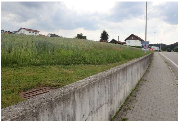
Blick nach Norden entlang der Ostgrenze des Planungsgebiets. Rechts der Gehweg entlang der Kreisstraße PAN 25 (Hauptstraße), links der schmale