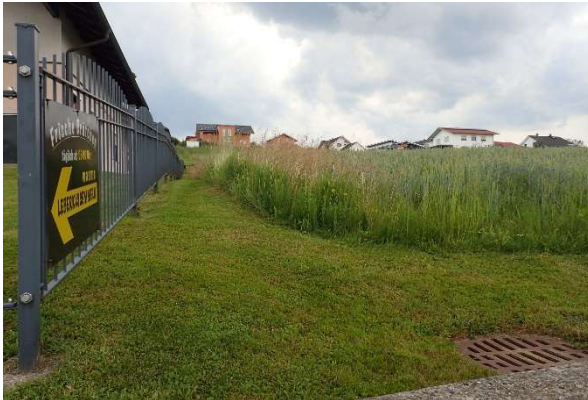
Blick nach Westen entlang der Südgrenze des Planungsgebiets (16.06.2022)