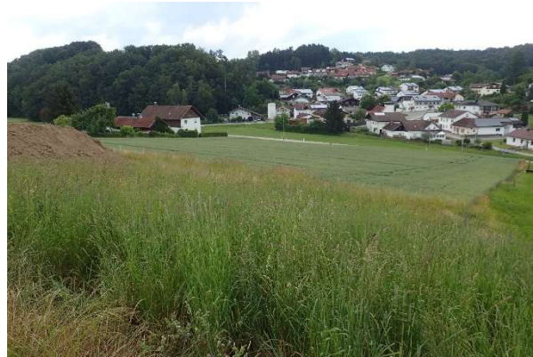
Blick von der Straße „Am Kirchhölzl“, Hausnr. 3, nach Nordosten über das Planungsgebiet in Richtung Taubenbach (16.06.2022)