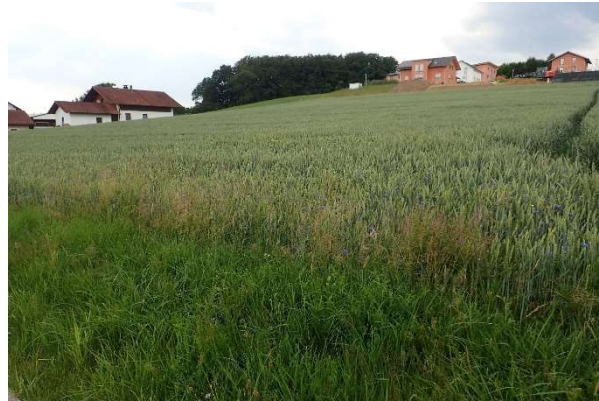
Blick vom Gehweg entlang der Kreisstraße PAN 25 über das Planungsgebiet in Richtung Südwesten (16.06.2022)