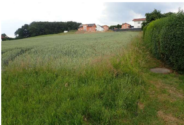
Blick entlang der Nordgrenze in Richtung Westen zum Baugebiet „WA Mittertaubenbach II“ (16.06.2022)