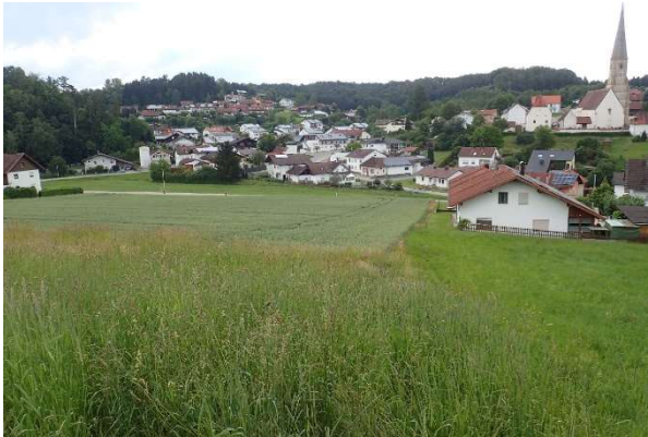
Blick von der Straße „Am Kirchhölzl“, Hausnr. 3, nach Osten über das Planungsgebiet in Richtung Taubenbach (16.06.2022)