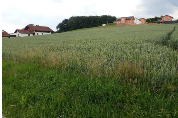
Blick vom Gehweg entlang der Kreisstraße PAN 25 über das Planungsgebiet in Richtung Südwesten (16.06.2022)