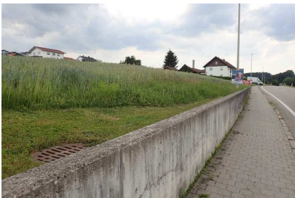
Blick nach Norden entlang der Ostgrenze des Planungsgebiets. Rechts der Gehweg entlang der Kreisstraße PAN 25 (Hauptstraße), links der schmale Grünstreifen über dem Schmutzwasserkanal zwischen Gehweg und Acker (16.06.2022)