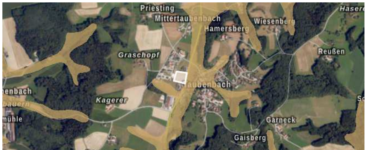
Abbildung 3: Screenshot aus dem BayernAtlas mit Darstellung des Wassersensiblen Bereichs (braun, transparent), Das Planungsgebiet ist in weiß skizziert; Darstellung ohne Maßstab

Das nächste Trinkwasserschutzgebiet ist Nr. 2210774300161 „Kirchdorf a. Inn - Harter Forst“ und beginnt etwa 2 km südlich.