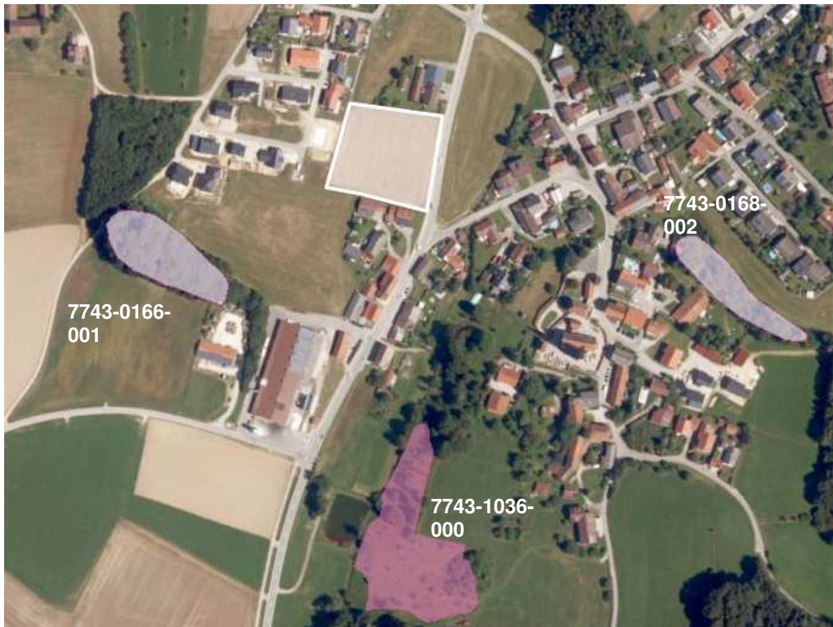
Abbildung 1: Planungsgebiet (weiß dargestellt) sowie amtlich kartierte Biotope (rosa-Töne); Screenshot aus dem BayernAtlas (Geobasisdaten © Bayerische Vermessungsverwaltung), ohne Maßstab

Das Planungsgebiet befindet sich im Schwerpunktgebiet des Naturschutzes „Taubenbacher Hügelland“.