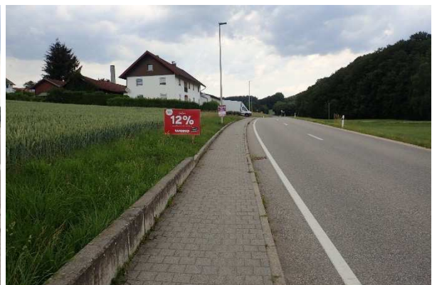
Blick entlang der Ostgrenze nach Norden zur Schreinerei Hiefinger; rechts von der Kreisstraße PAN 25 befindet sich die Aue des Lohbachs (16.06.2022)