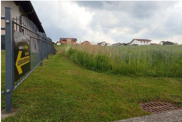
Blick nach Westen entlang der Südgrenze des Planungsgebiets (16.06.2022)