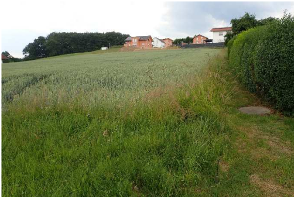
Blick entlang der Nordgrenze in Richtung Westen zum Baugebiet „WA Mittertaubenbach II“ (16.06.2022)