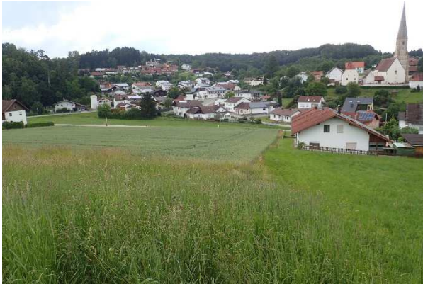
Blick von der Straße „Am Kirchhölzl“, Hausnr. 3, nach Osten über das Planungsgebiet in Richtung Taubenbach (16.06.2022)