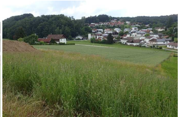
Blick von der Straße „Am Kirchhölzl“, Hausnr. 3, nach Nordosten über das Planungsgebiet in Richtung Taubenbach (16.06.2022)