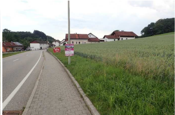
Blick vom Ostrand des Planungsgebiets in Richtung Süden; links die Kreisstraße PAN 25, rechts das Planungsgebiet (16.06.2022)