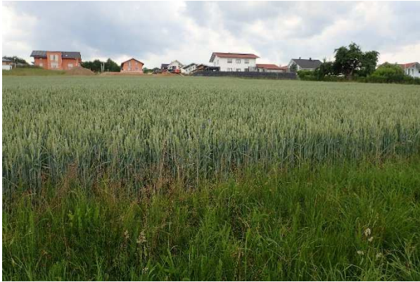
Blick nach Westen zum Baugebiet „WA Mittertaubenbach II“ (16.06.2022)