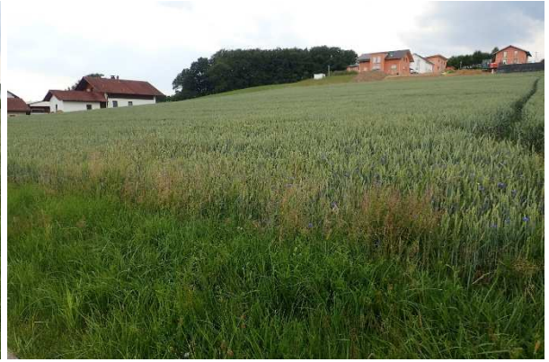
Blick vom Gehweg entlang der Kreisstraße PAN 25 über das Planungsgebiet in Richtung Südwesten (16.06.2022)