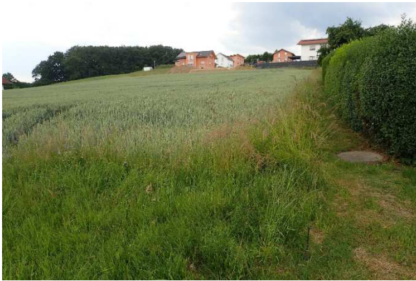
Blick entlang der Nordgrenze in Richtung Westen zum Baugebiet „WA Mittertaubenbach II“ (16.06.2022)