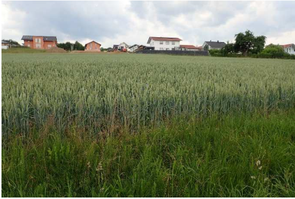
Blick nach Westen zum Baugebiet „WA Mittertaubenbach II“ (16.06.2022)