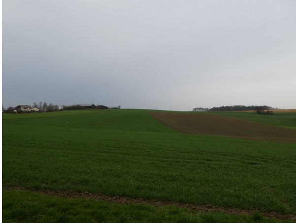
Abbildung 3: Blick auf Kuppe (northwestlicher Geltungsbereich)

Weiler Damreiher mit einem verfallenen Vierseithof. Nach Osten fällt das Gelände in Richtung Wald ab. Im Bereich des Waldrandes im Osten erstreckt sich eine Waldsimsenflur entlang eines kleinen Bachlaufs. Dieser wird weiter östlich und südlich von einem Erlenauwald begleitet. Diese zuletzt genannten Flächen gelten gemäß §30 BNatSchG als gesetzlich geschützte Flächen.