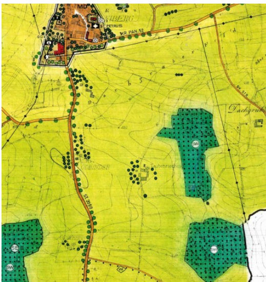
Abbildung 1: Ausschnitt aus dem rechtskräftigen Flächennutzungsplan des Marktes Tann

Der Flächennutzungsplan wird im Parallelverfahren durch Deckblatt Nr. 26 geändert.