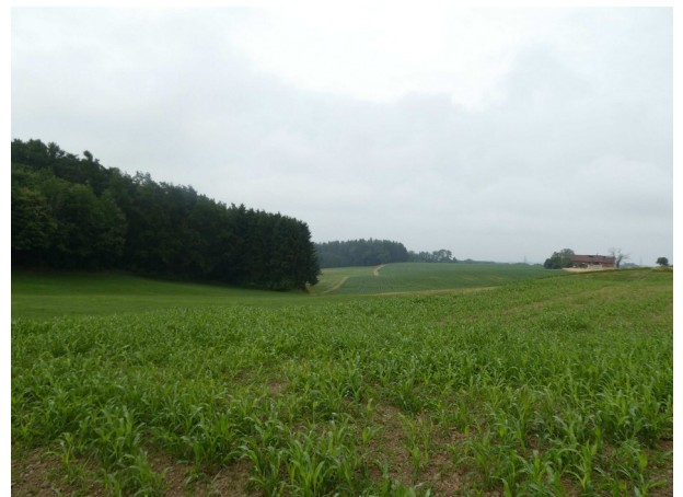
Abbildung 6: Blick auf Geltungsbereich von Norden