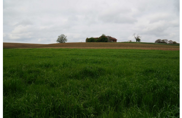
Abbildung 4: Blick nach Westen zum Weiler Damreiher