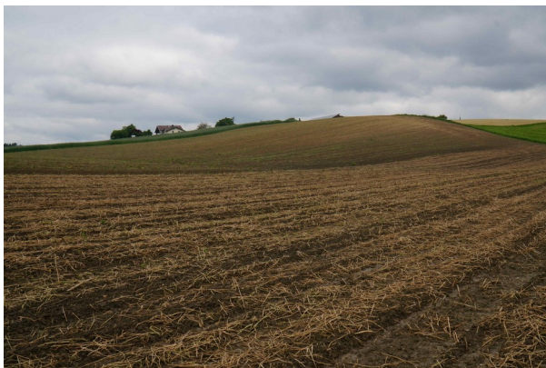
Abbildung 5: Blick auf Kuppe im Nordwesten