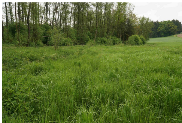
Abbildung 8: Waldrand mit Waldsimseflur im Osten

Ein Vorkommen bodenbrütender Vogelarten der Agrarlandschaft konnte ohne Erhebungen nicht sicher ausgeschlossen werden. Demzufolge erfolgte eine Kartierung nach der Revierkartierungsmethode (Südbeck et al., 2005). Dabei wurden bei geeigneter Witterung an folgenden Terminen Erhebungen in den frühen Morgen-/Vormittagsstunden durchgeführt.