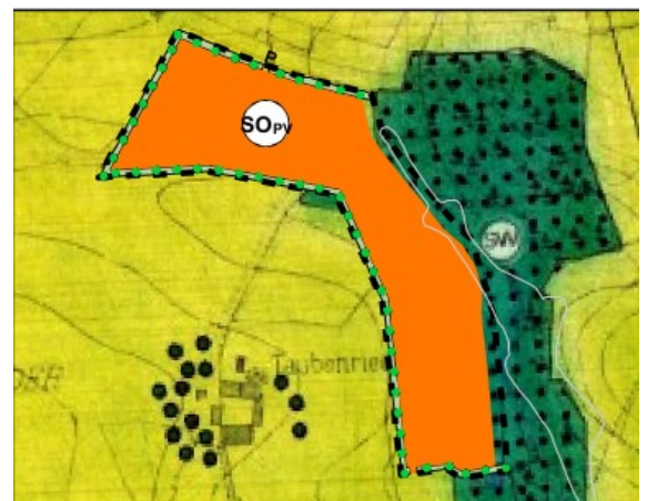
Abbildung 2: FNP-Deckblatt 26 im Vorentwurf vom 21.03.2024