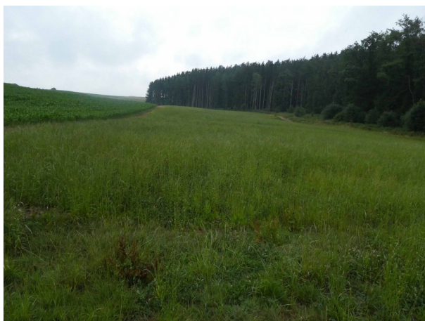
Abbildung 7: Blick auf Geltungsbereich von Süden