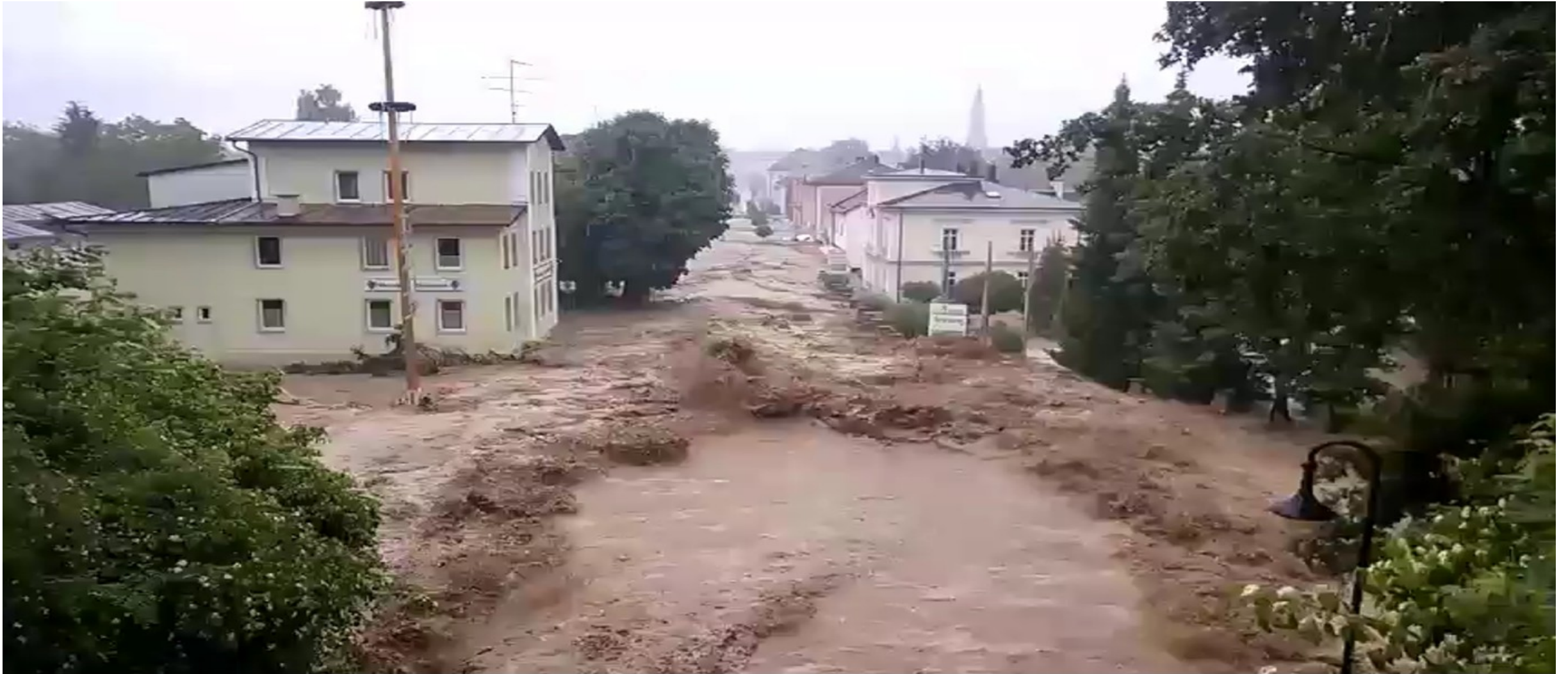
1. Juni 2016 – Simbach am Inn