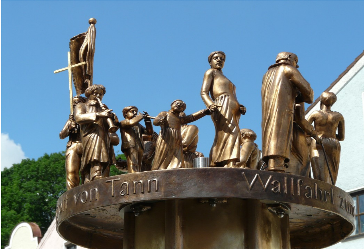
Wallfahrtsbrunnen beim Rathaus