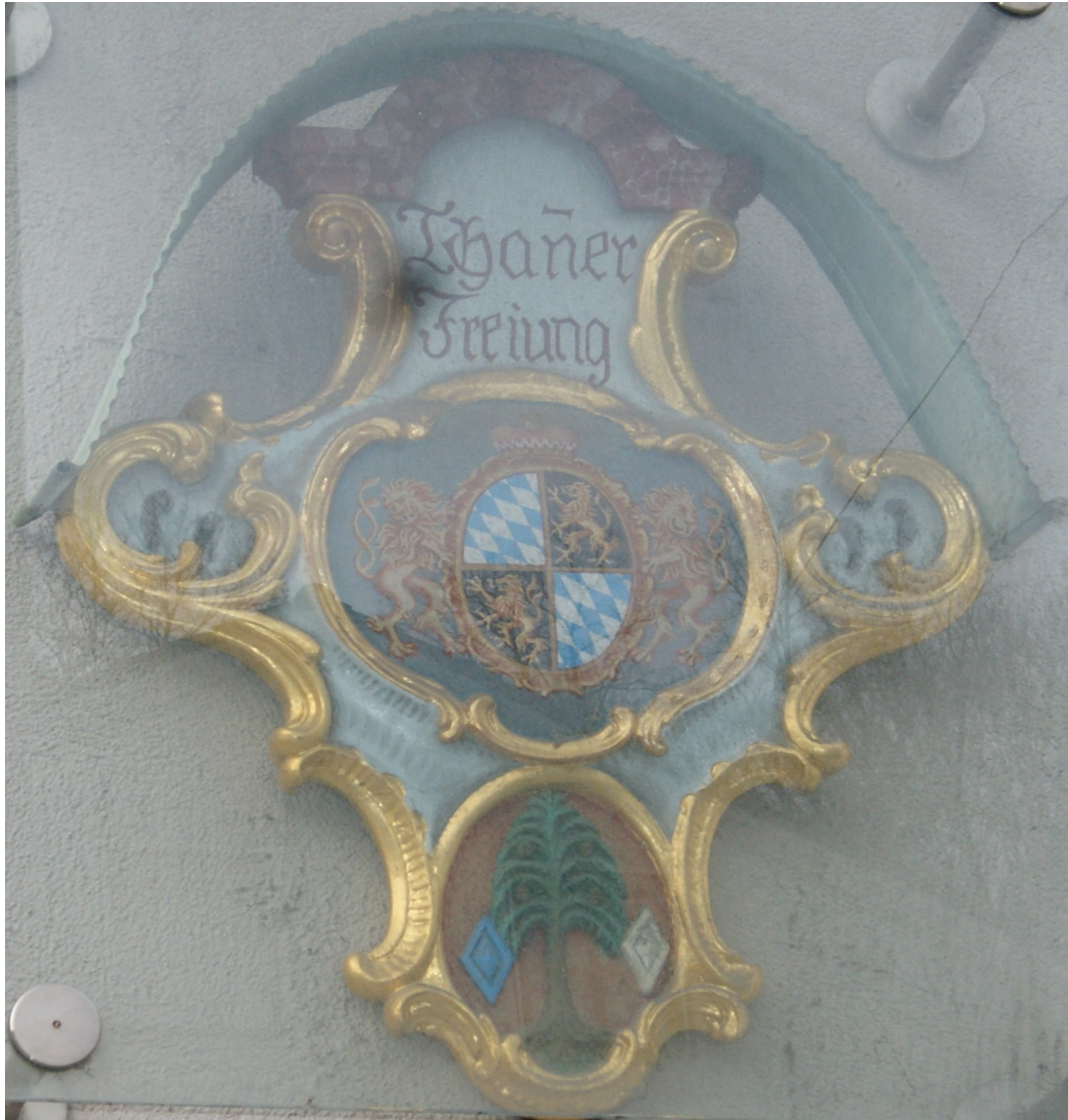
Markt Tann - Freitung